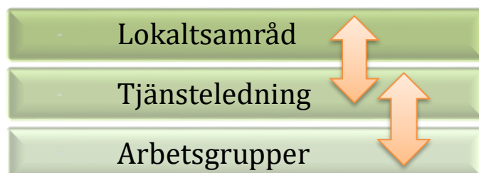
Figur 1. Återkoppling sker genom hela närvårdsorganisationen